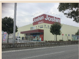
ジョーシン長野インター店 890m