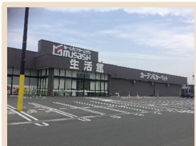
ホームセンタームサシ長野南店 1.1km